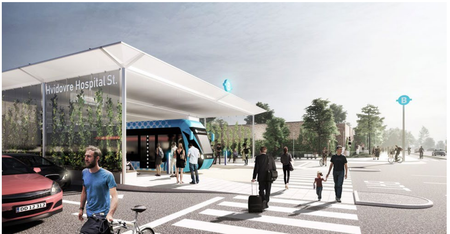
Eksempler på BRT-løsning. Visualiseringer: Urban Power og Movia.