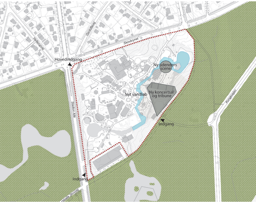
Situationsplan - nye tiltag i Tivoli Friheden