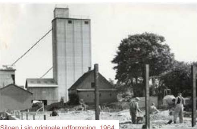
Siloen i sin originale udformning, 1964