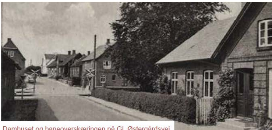
Damhuset og baneoverskæringen på Gl. Østergårdsvej