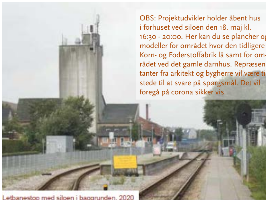
Letbanestop med siloen i baggrunden, 2020

Tilmelding via deltag.aarhus.dk senest den 16. maj 2021 kl. 12.00