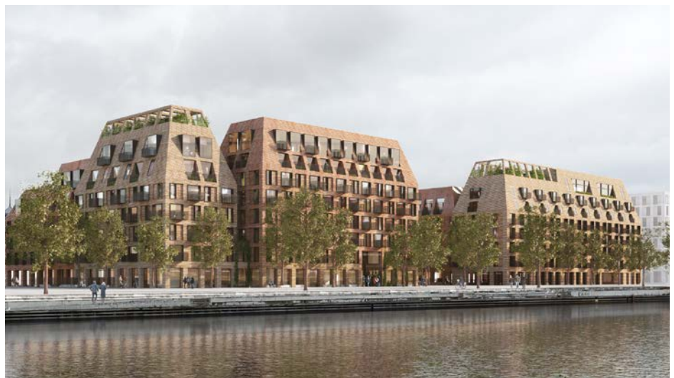
Visualisering af vinderprojekterne på Felt B og C. Set fra Kystvejen.