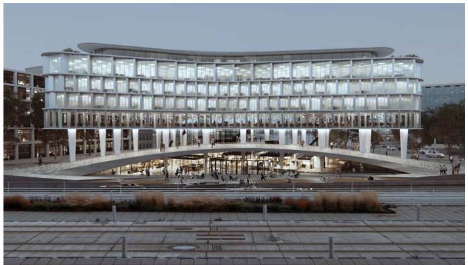
Visualisering fra vinderprojektet på Felt A. Set fra vest/Kystvejen.

Indsendte høringssvar vil blive forelagt byrådet, når lokalplanforslaget behandles med henblik på endelig vedtagelse.