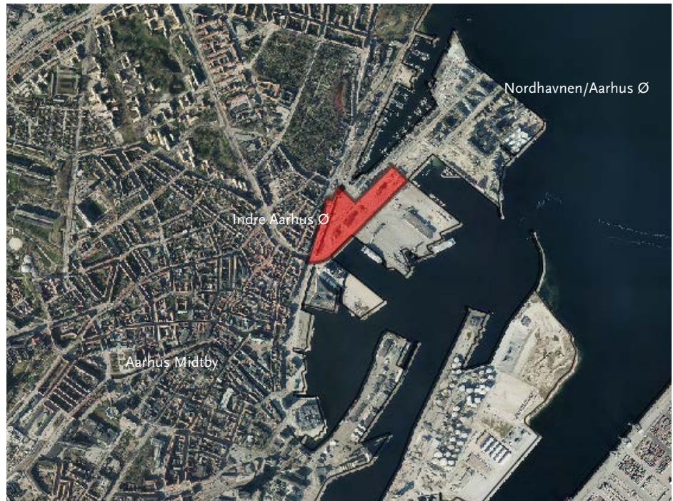
Luffoto, der viser Aarhus Midtby og Nordhavnen. Den røde figur markerer det område, hvor kommuneplanens rammer skal ændres, for at udviklingsplanen kan blive realiseret.