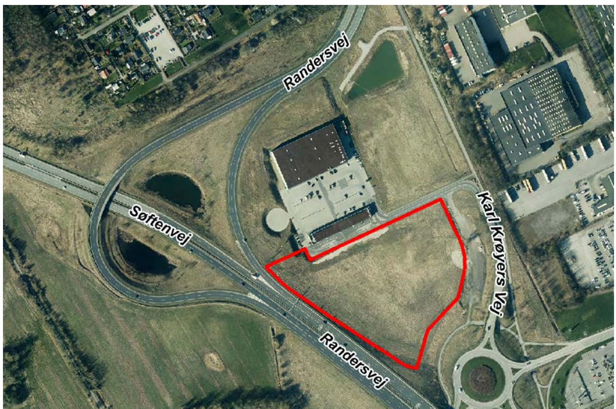
Luftfoto over området.

På www.aarhus.dk/kommuneplan kan du læse mere om kommuneplanens visioner og mål, og om de retningslinjer og formelle rammer, der gælder i dag. På www.aarhus.dk/lokalplaner kan du læse mere om lokalplanprocessen.