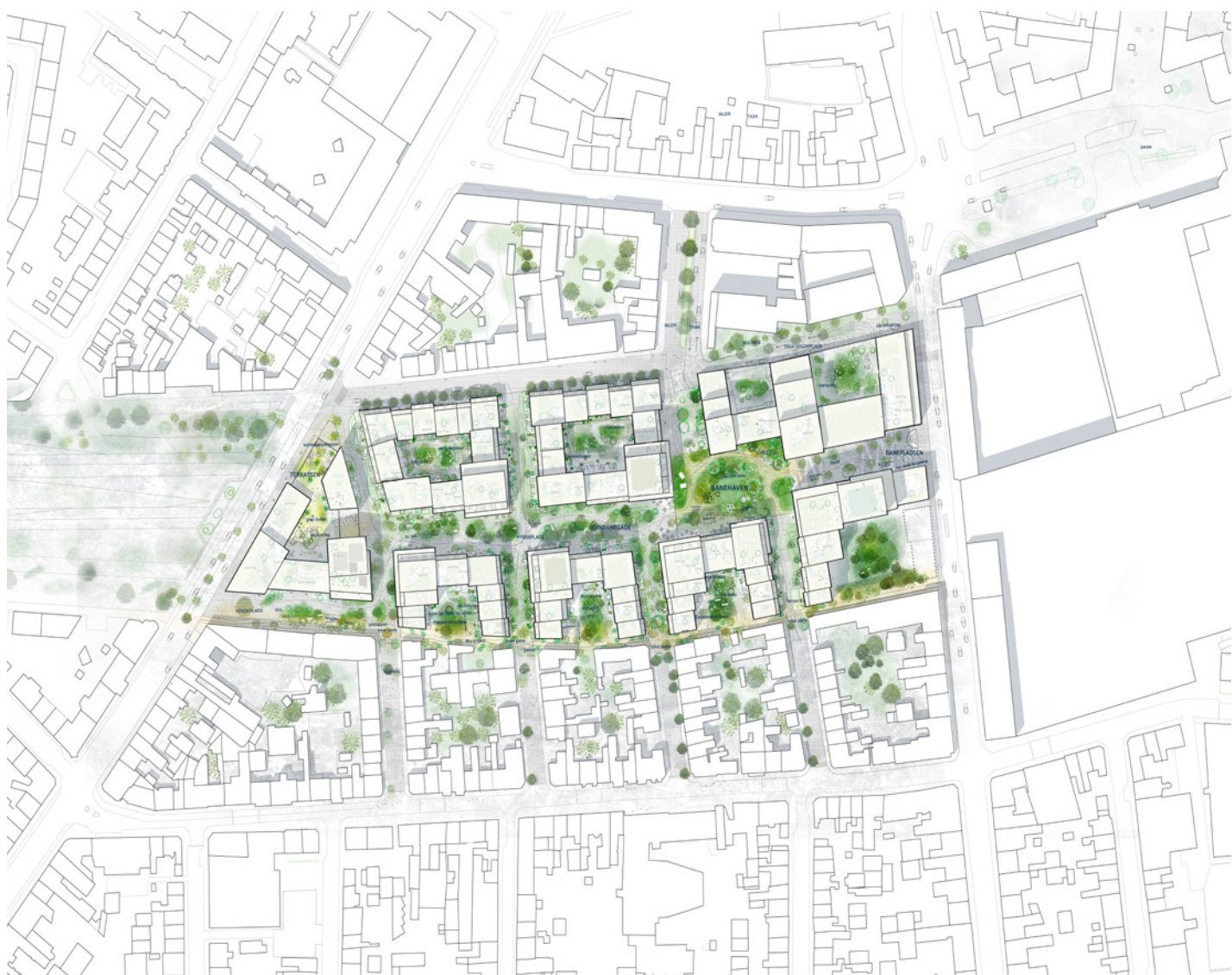
Illustrationsplan fra skitseforslaget