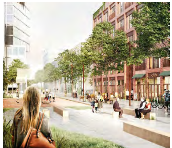
Byrummet ved strøgforsbindelsen