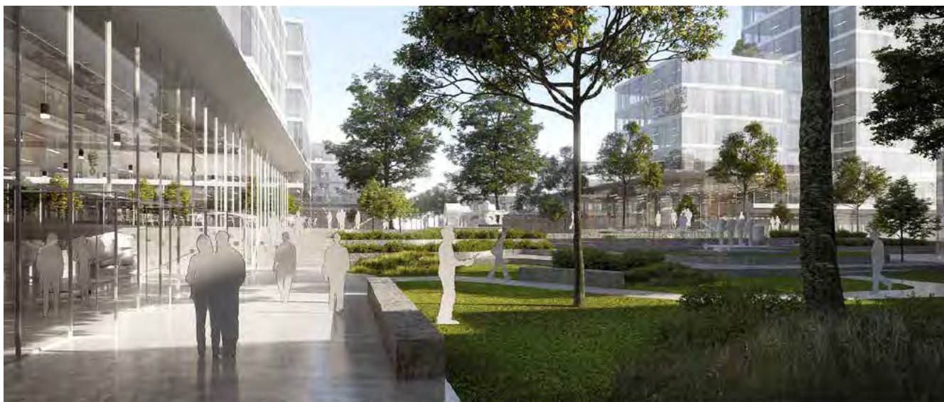
Parken set fra nord mod syd