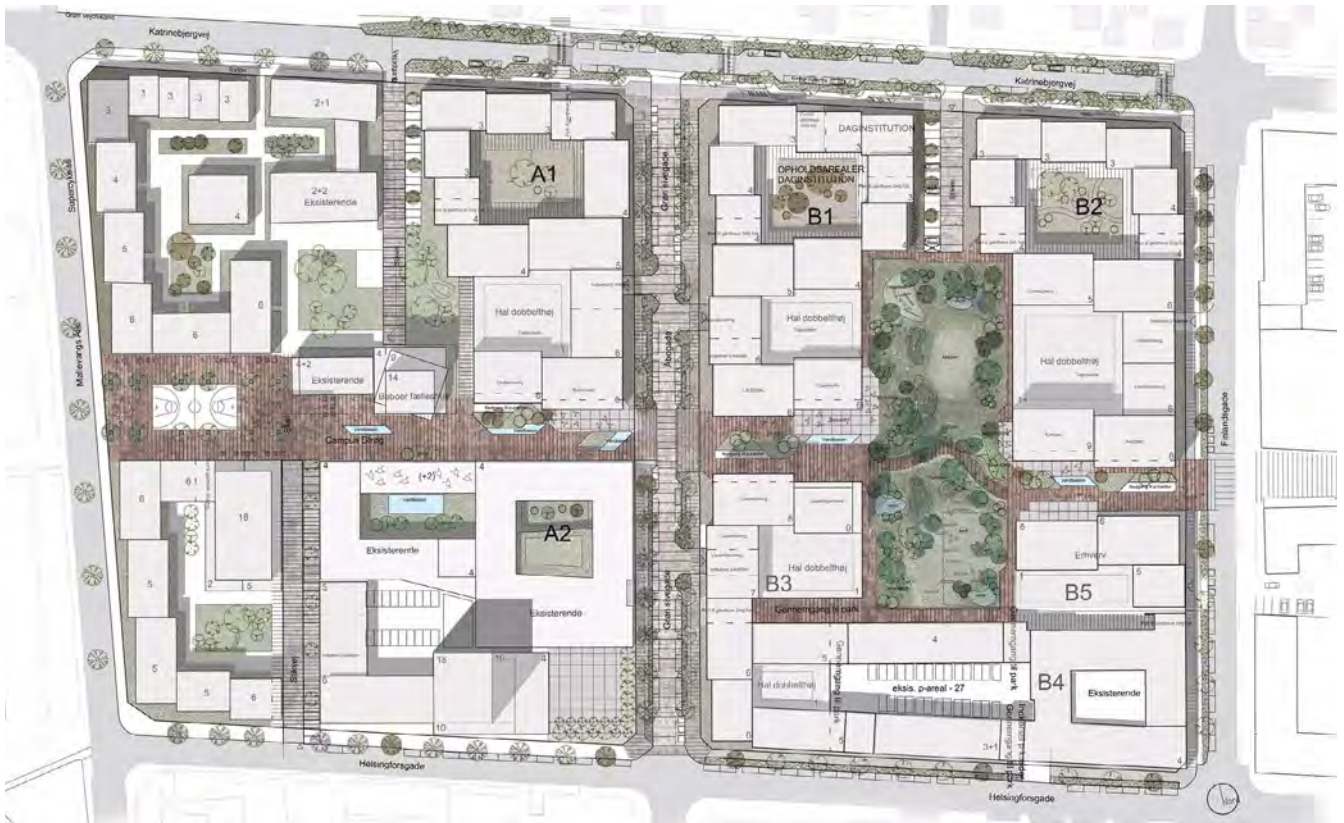
Situationsplan der viser områdets foreslåede fremtidige udseende med park, strøgforsbindelse, byrum og bebyggelse.