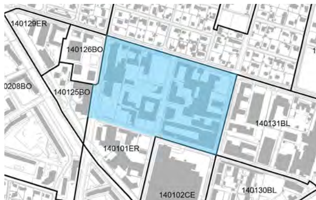
Kommuneplan 2017 - det areal, der foreslås overført fra erhvervsområde til blandet byområde, er vist med blå

Planlægningen er i overensstemmelse med kommuneplanens mål om fortætning og om at skabe attraktive blandede byområder. Kommuneplanen understøtter fortætning i bestemte områder ud fra bestemte præmisser. Det skal være en god idé og der skal sikres kvalitet. Katrinebjerg er en del af vidensaksen, der forbinder størstedelen af byens uddannelsesinstitutioner og her ønsker byrådet at koncentrere byvæksten med projekter, der kan bidrage positivt til at skabe den gode by. Omdannelsen af Katrinebjerg fra erhvervsområde til blandet byområde med boliger, offentlig service, små butikker, studie- og arbejdspladser samt park og byrum er med til at give et godt og levende bymiljø i området døgnet rundt.