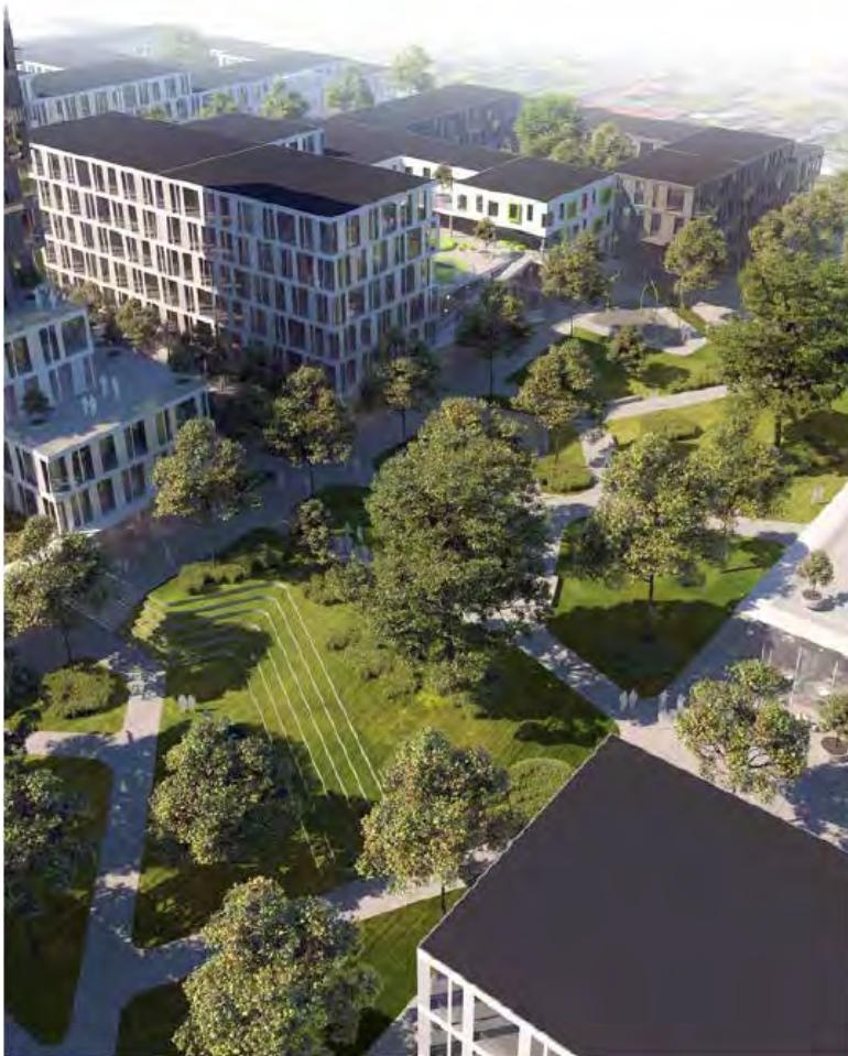
View over parken