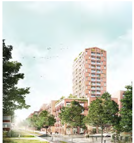
Bebyggelsen fra Møllevangs Allé og Helsingforsgade