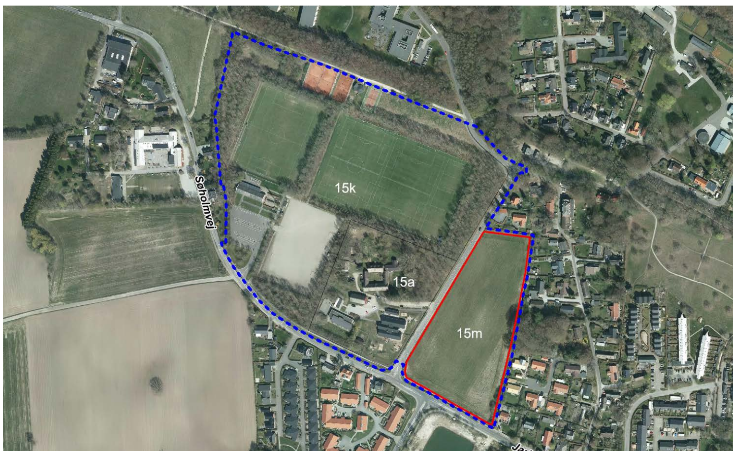
Luftfoto der med blå afgrænsning viser potentielt planområde og med rød afgrænsning placering af en multihal på matr.nr. 15m