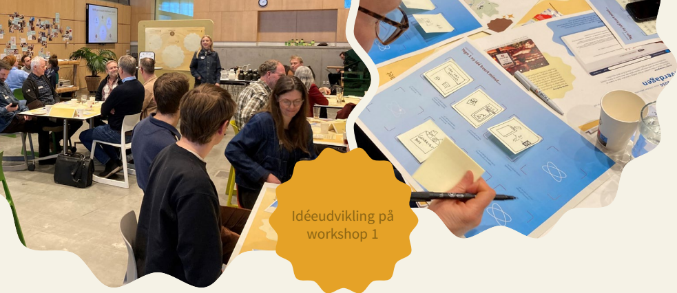
Idéudvikling på workshop 1