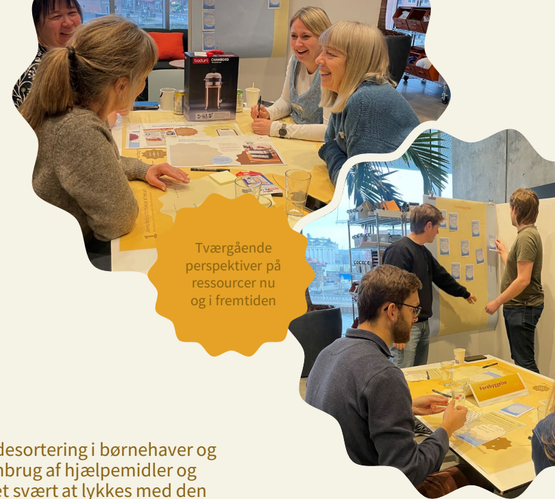
Tværgående perspektiver på ressourcer nu og i fremtiden