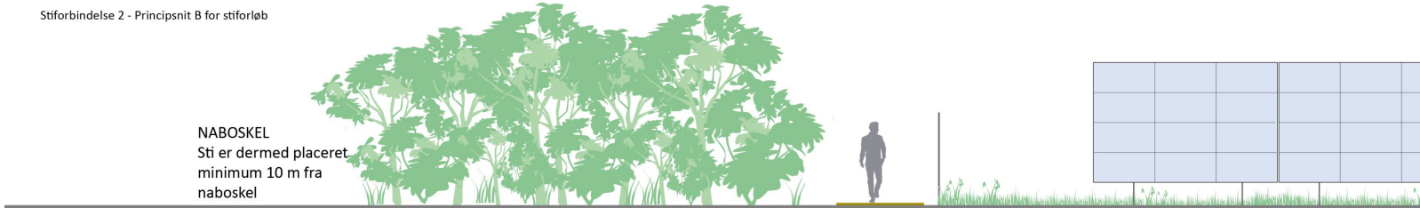
Stiforbindelse 2 - Principsnit B for stiforløb

NABOSKEL Sti er dermed placeret minimum 10 m fra naboskel