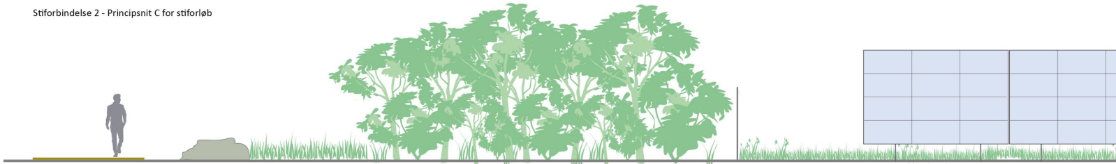
Stiforbindelse 2 - Principsnit C for stiforløb