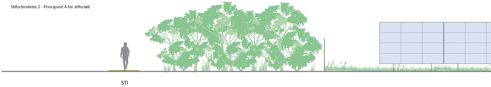
Stiforbindelse 2 - Principsnit A for stiforløb