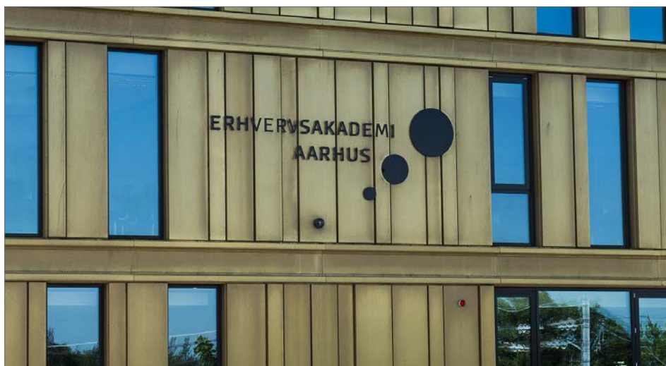
Foto: Uddannelsesinstitutionens grafiske identitet er nøje tilpasset bygningen og bliver en del af bebyggelsens arkitektur, Sønderhøj/Ringvej

tilpasset bygningens facadehøjde, dog højst 10 m.