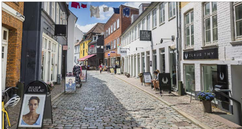
Foto: Latinerkvarteret omfattet af bevarende lokalplan med bestemmelse om skiltning

Afsnittet kan bruges som checkliste over forhold, der altid bør undersøges inden opsætning af skilte.