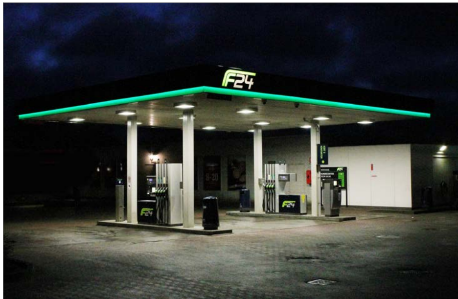
Foto: Tankstation ved butikstorv. Visuelt meget synligt, når mørket falder på, men samtidig let og svævende, Beder

logoer, der er indvendigt belyst, eller bagud-belyst, eller bøjede neonrør. Øvrige lyskasser, lyskabler og lignende kan som udgangspunkt ikke opsættes.