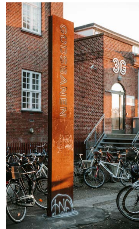
Foto: Pylon i cortenstål tilpasset bygningsmiljøet leder tankerne hen på de gamle togskiner, Skovgaardsgade

er udført i materialer og farver, der er neutrale i forhold til facaden. Belysningen skal være en integreret del af skiltets design.