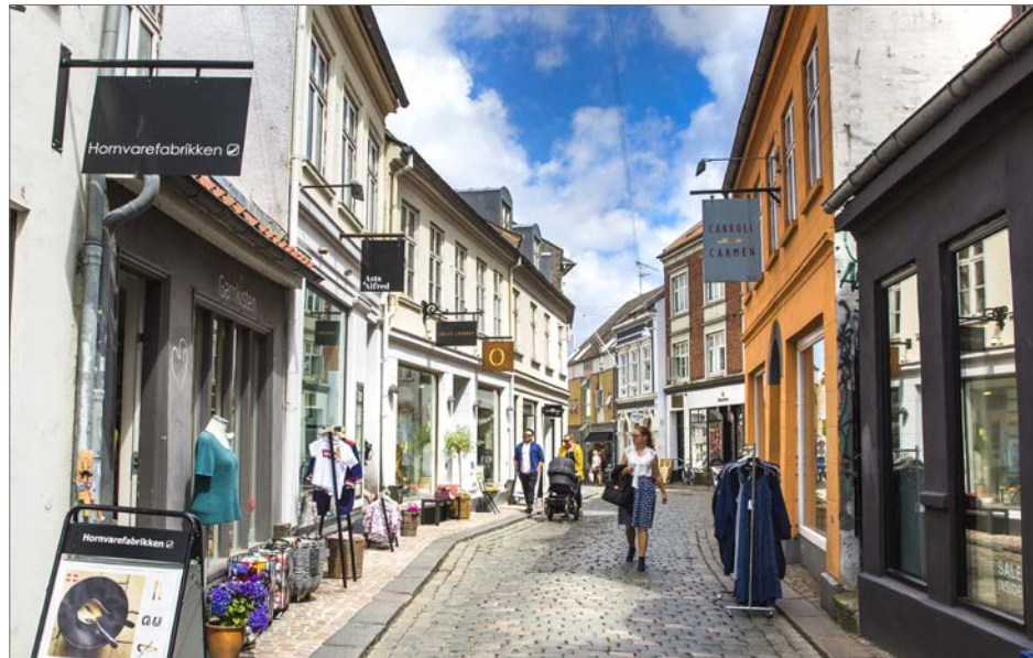
Foto: Skiltningen er mangfoldig, men indgår i et helhedsbillede, hvor husene stadig tegner gadebilledet, Volden