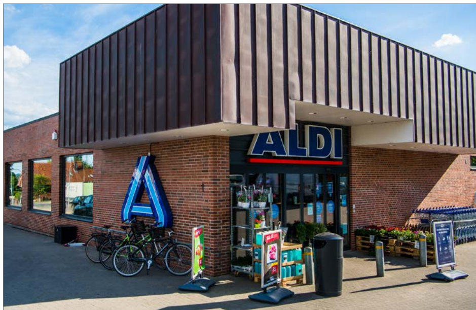
Foto: Kombination af navn mod indgangsparti og logo mod vej, Carit Etlars Vej