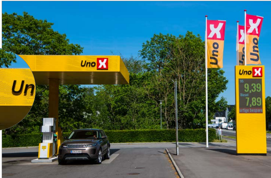
Foto: Perforerede metalplader på både salgspads og pylon skaber sammenhæng, Silkeborgvej