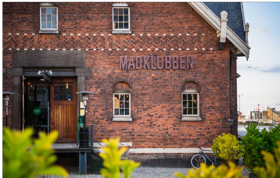
Foto: Skiltning tilpasset den bevaringsværdige ejendom, Hack Kampmanns Plads

Skilte skal tilpasses stedet ud fra en helhedsbetragtning, hvad enten det er smalle gader og historiske bygninger, butiksstrøg, boligområder, brede indfaldsveje med erhvervsbebyggelser eller det åbne land med videre.