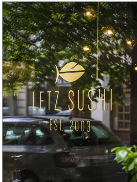
Foto: Logo og bogstaver på butiksrude, Guldsmedgade