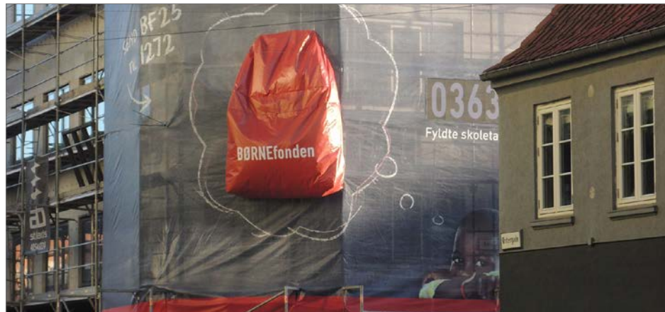
Foto: Stilladsreklame, Søndergade

Der kan også være situationer, hvor der er ønske om midlertidigt at markere et arrangement eller en event. I forbindelse med Aarhus Kommunes Eventstrategi arbejdes der blandt andet med en synliggørelse og udvikling af byens fysiske muligheder for at markedsføre events, herunder "at klæde byen på til fest".