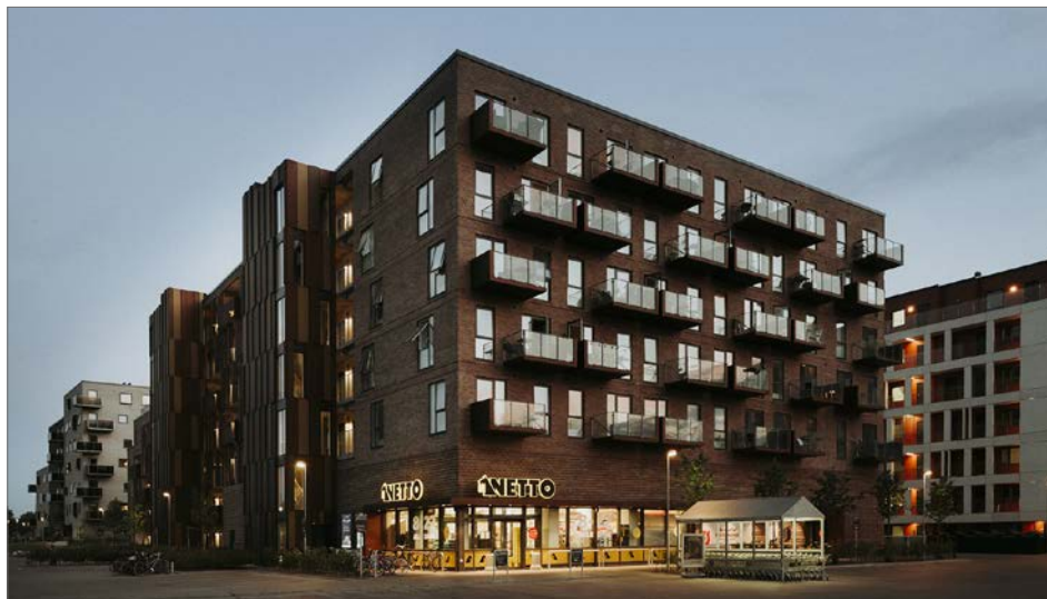
Foto: Lyskilte i stueetagen, Søren Frichs Vej

Bymæssig bebyggelse i øvrigt starter udenfor city-afgrænsningen. Det dækker Godsbanen, karrékvarterernes store boligområder, Aarhus Ø, de gamle forstæder såsom Højbjerg, Hasle og Åbyhøj, som er vokset sammen med den øvrige by, og de nye forstæder såsom Lystryp, Beder og Tranbjerg, der er opstået omkring tidligere landsbyer. Det dækker også landsbyerne, de mindre erhvervsområder samt områder til offentlige formål.