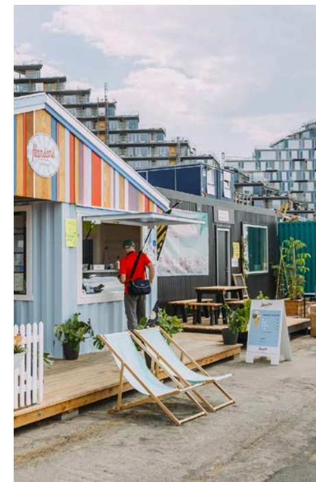
Foto: Byggetilladelse til midlertidigt byggepladshegn med salgsoverdækninger med videre ved Havnebadet, Aarhus Ø

I forbindelse med beslutninger om byfornyelse eller støtte til almene bebyggelser (offentligt støttede byggearbejder) kan der stilles en række krav til byggearbejderne, som er af betydning for de enkelte bygningers fremtidige udseende, herunder krav til skilte og reklamer og lignende. Overholdelse af kravene vil være en betingelse for godkendelse af de støtteberettigede arbejder.