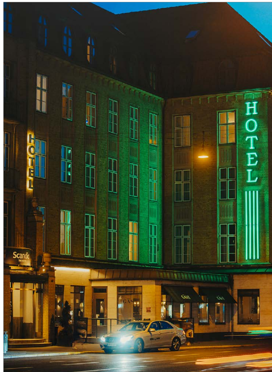
Foto: Skilte og lys i kombination er med til at skabe en levende og attraktiv bymidte, Park Allé

Kunstnerisk udsmykning af facader, eksempelvis galvmalerier, der malet direkte på en gavl, er heller ikke omfattet af retningslinjerne. De har blandt andet i kraft af deres størrelse og udtryk en væsentlig, visuel indvirkning i lokalområdet, som vil kræve en anden vurdering end sædvanlig skiltning.