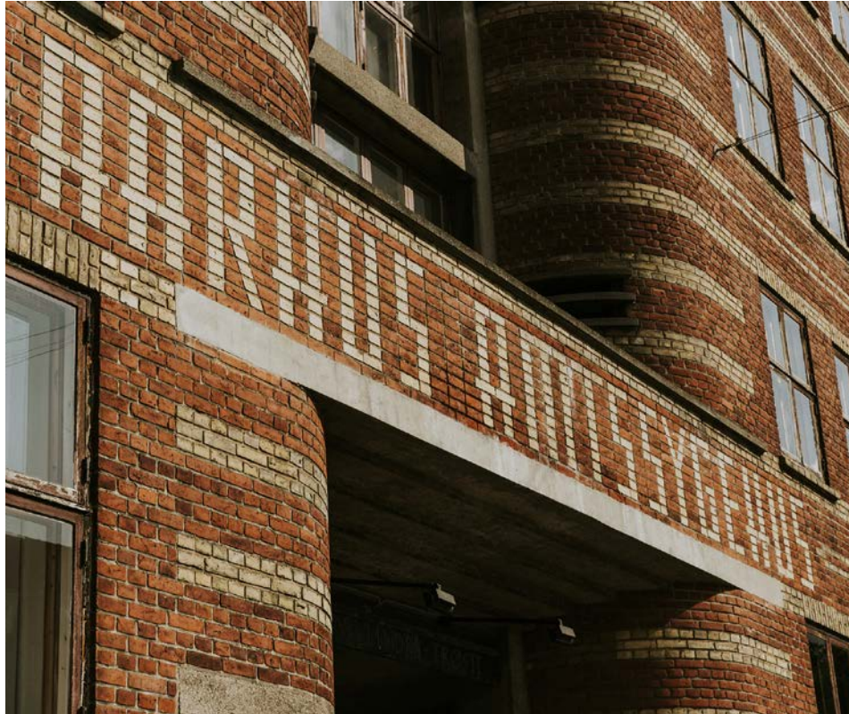
Foto: Bygningens navn indgår som et elegant element i arkitekturen, Tage-Hansens Gade