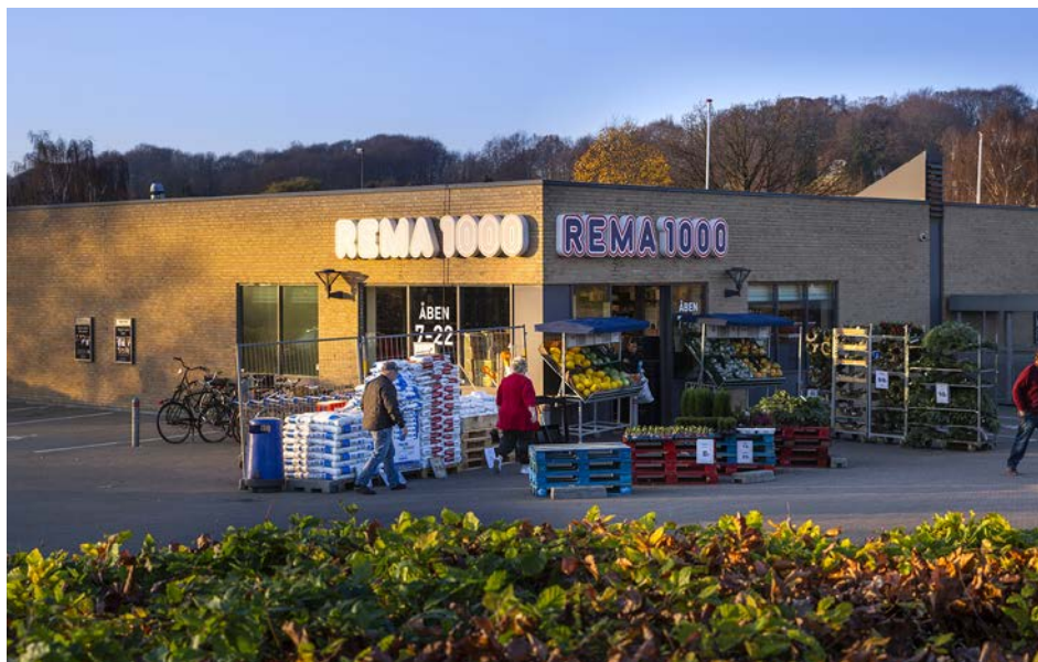
Foto: Velplaceret facadeskiltning ved indgangen afleverer budskabet effektivt, Rema 1000, Stenbækvej/Silkeborgvej

Ved fritliggende dagligvarebutikker forstås enkeltstående butikker på op til 1.000 m 2 brutto-etageareal, som ligger uden for City og uden for centerområder eller butikstove i tilknytning til lokalt opland.