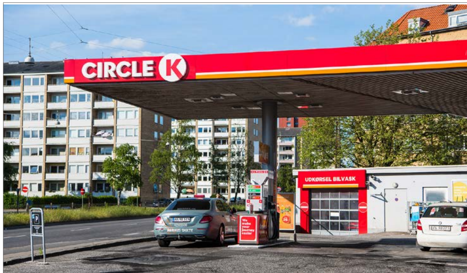
Foto: Tankstation ved Marselis Boulevard/Skanderborgvej

Service- og benzinstationer kan ligge i meget forskellige byområder. De adskiller sig ofte fra omgivelserne i kraft af deres farvevalg, lys- og standerskilte og flagning.