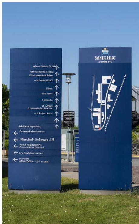
Foto: Overskueligt skiltekoncept for et større erhvervsområde med forskellige virksomheder, Sønderhøj