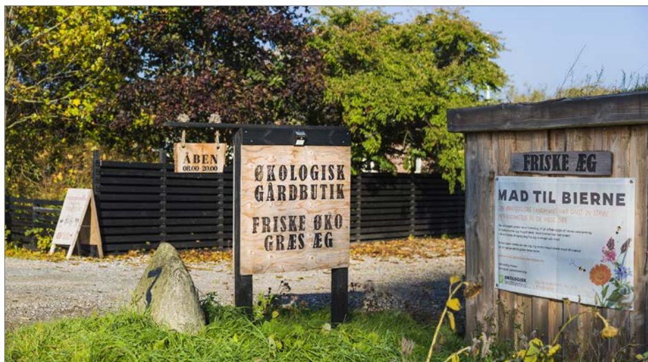
Foto: Indkørsel til gårdbutik

Det åbne land skal vurderes i forhold til landskabets udseende og ikke i forhold til opdelingen i by- og landzone. Det åbne land er alt det, der ikke er bymæssig bebyggelse. Det kan også være et planlagt erhvervsområde, der ikke er udbygget. Mindre samlinger i landskabet af spredt bebyggelse betragtes ikke som bymæssig bebyggelse.