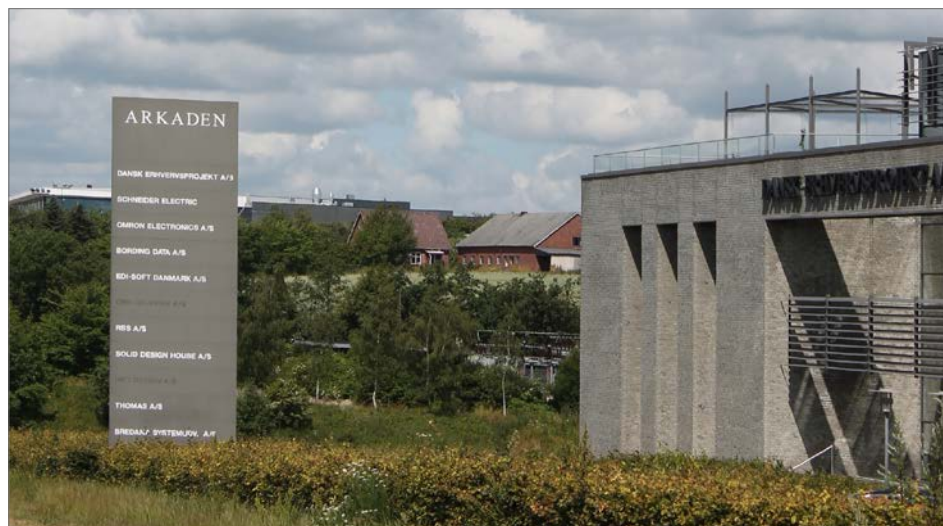
Foto: Samordnet skiltning på pylon giver et godt helhedspræg, Viborgvej (Bredskiftevej)

Afsnittet gælder for indfaldsvejene og de overordnede veje (i kommuneplanen nævnt som de overordnede trafikveje og store trafikveje) samt for de erhvervsområder, som ligger i tilknytning hertil, uden for Ringgadesystemet. Erhvervsområder i landskabet, der ikke er udbygget, er omfattet af afsnittet "Det åbne land".