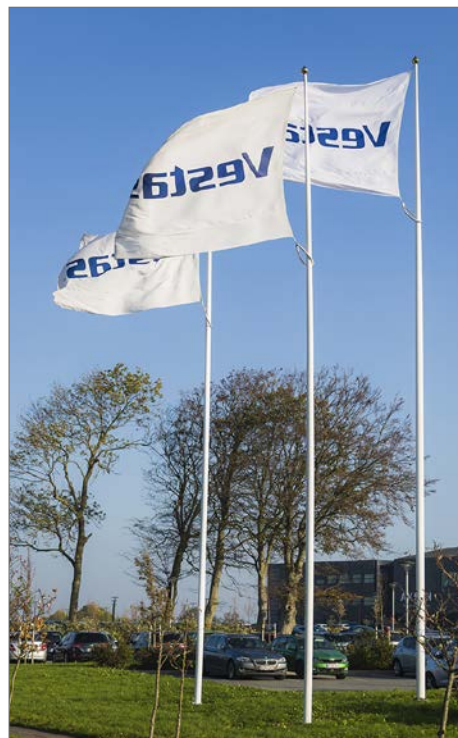
Foto: Flaggruppe trukket tilbage på det grønne forareal, Hedeager