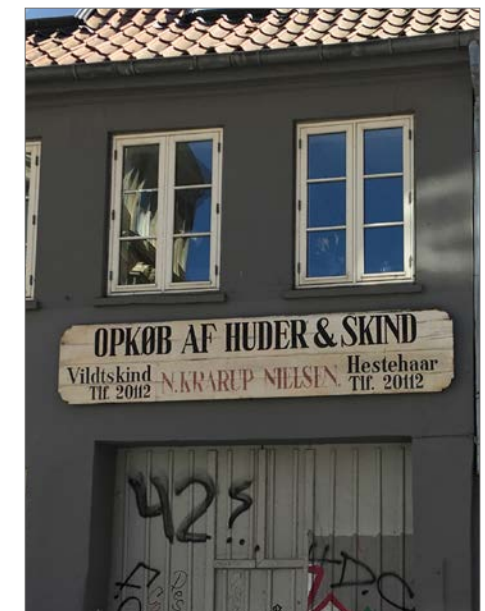
Foto: Bevaret skilt sikrer bygningens fortællerværdi, Vestergade

Placering af skilte skal altid ske under hensyn til trafikafviklingen, og skiltning må ikke forhindre den frie oversigt og udsyn til offentlige skilte og trafikregulerende foranstaltninger.