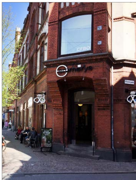
Foto: Hjørnebutik med skiltning til flere sider, Guldsmedgade og Klostergade