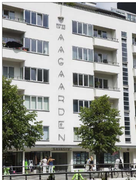
Foto: Bygningens navn over flere etager, Åboulevarden