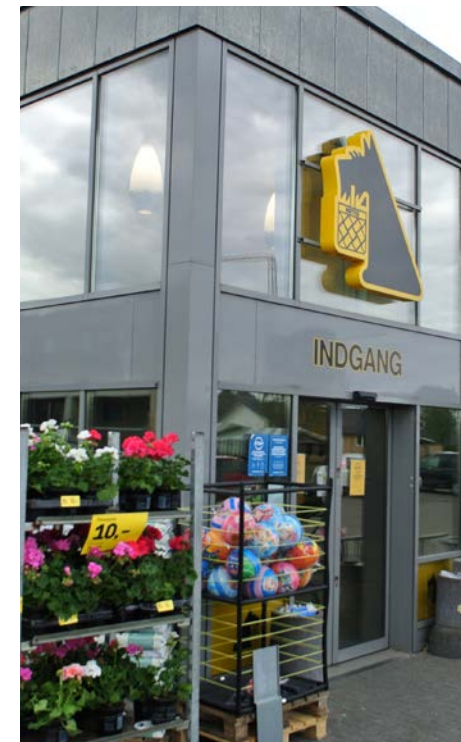
Foto: Indgangspartiet med logo træder tydeligt frem, bydelscenter ved Nordre Strandvej

Digitale skilte må ikke vise bevægelige billeder, der kan opfattes som film, og skærmene må ikke flimre. Digitale skilte skal opfylde kravene i afsnittet om "Tekniske retningslinjer for digitale skilte".