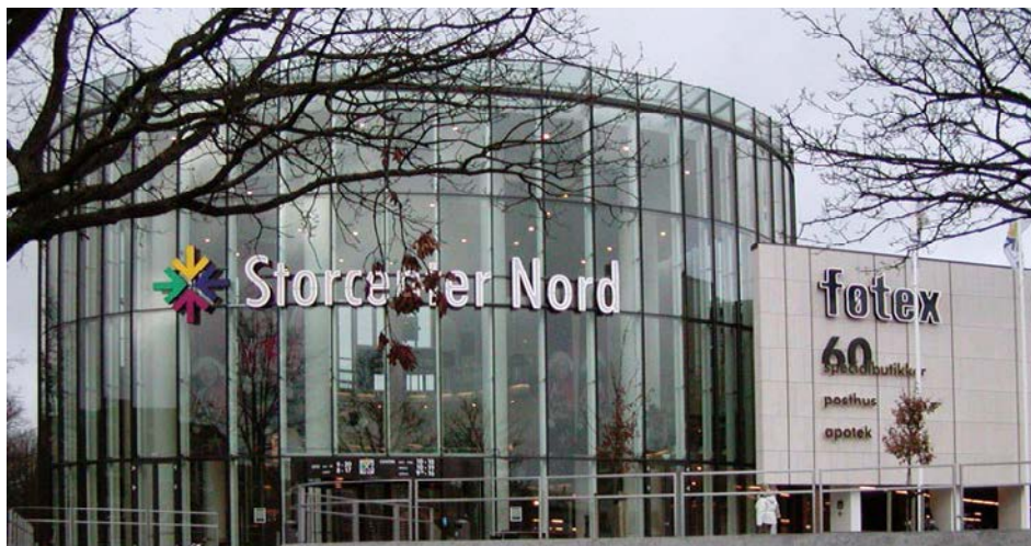
Foto: Storcenter Nords hovedindgang ved Paludan Müllers Vej/Finlandsgade

Afsnittet dækker bredt over områderne til detailhandel uden for City (i kommunenplanen er de nævnt som bydelscentre, bycentre, lokale butikcentre og aflastningscentre).