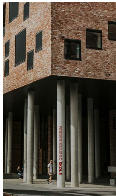
Foto: Enkel skiltning på søjle giver en letforståelig markør, der ikke tager fokus fra bygningen, Ingerslevs Boulevard

Belysning af skilte skal være afdæmpet i forhold til omgivelserne og må ikke være bevægeligt. Belysning skal afgrænses til kun at belyse selve skiltet – ikke facaden. Der skal være mulighed for lysregulering.