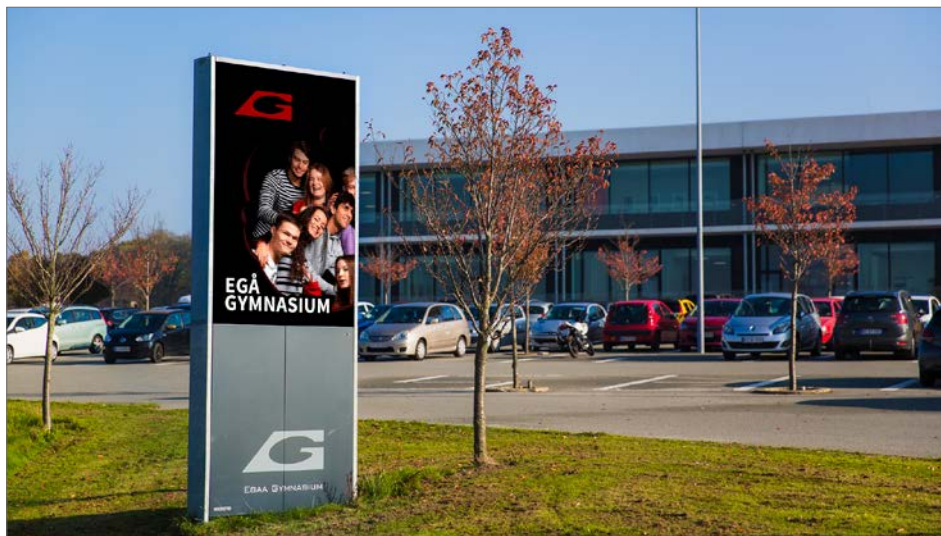
Foto: Digital pylon ved Egå Gymnasium, Mejlbjvej

Der, hvor der er mulighed for at opsætte digitale skilte i forhold til retningslinjerne i de forudgående afsnit, skal skiltningen opfylde en række generelle og tekniske krav til lysstyrke og indholdsskift med videre, der skal sikre, at skiltningen ikke dominerer området eller generer omgivelserne.